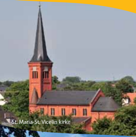
St. Maria-St. Vicelin kirke