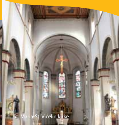
St. Maria-St. Vicelin kirke